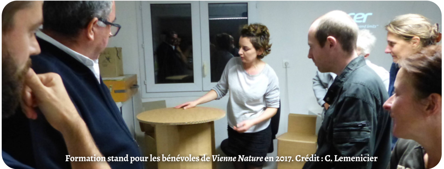
Formation stand pour les bénévoles de Vienne Nature en 2017.