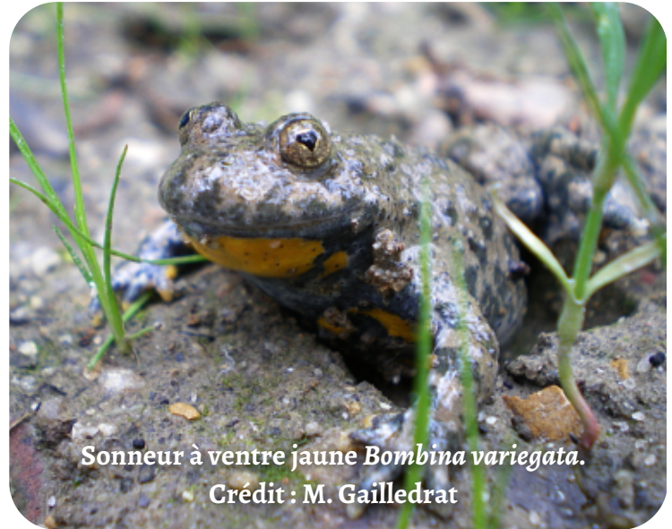
Sonneur à ventre jaune Bombina variegata .