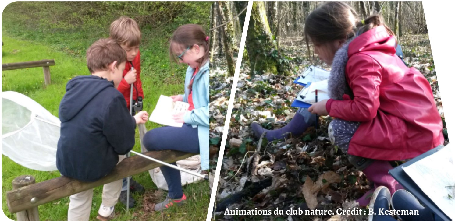
Animations du club nature.