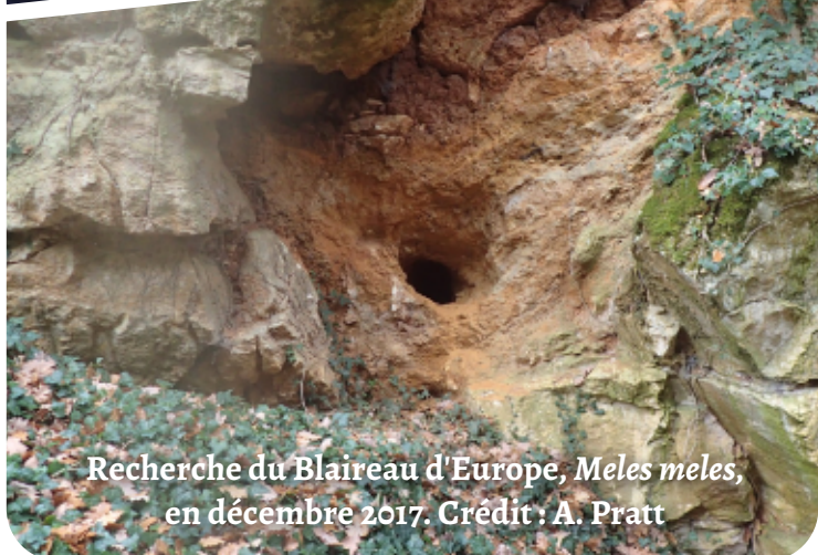
Recherche du Blaireau d'Europe, Meles meles , en décembre 2017.