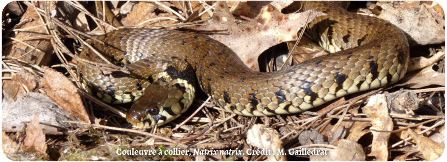
Couleuvre à collier, Natrix natrix .