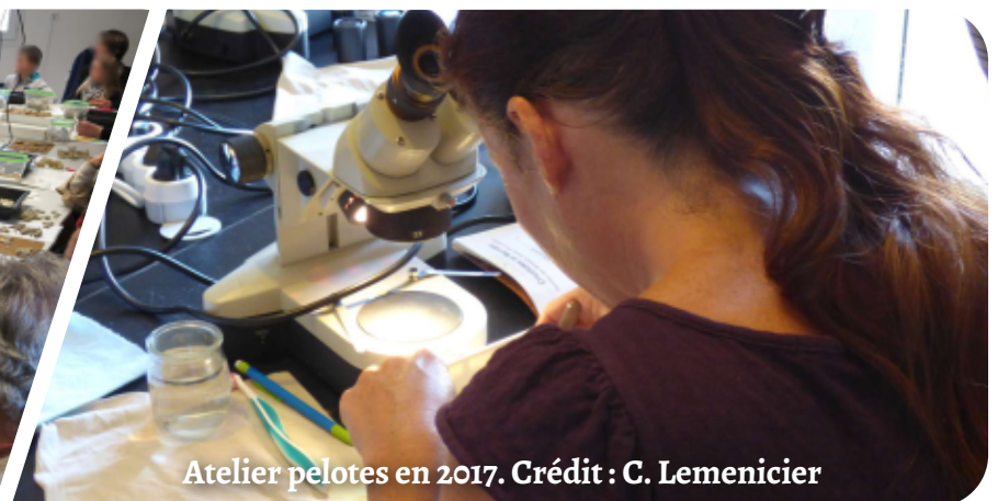
Atelier pelotes en 2017.