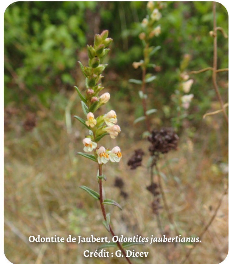
Odontite de Jaubert, Odontites jaubertianus .