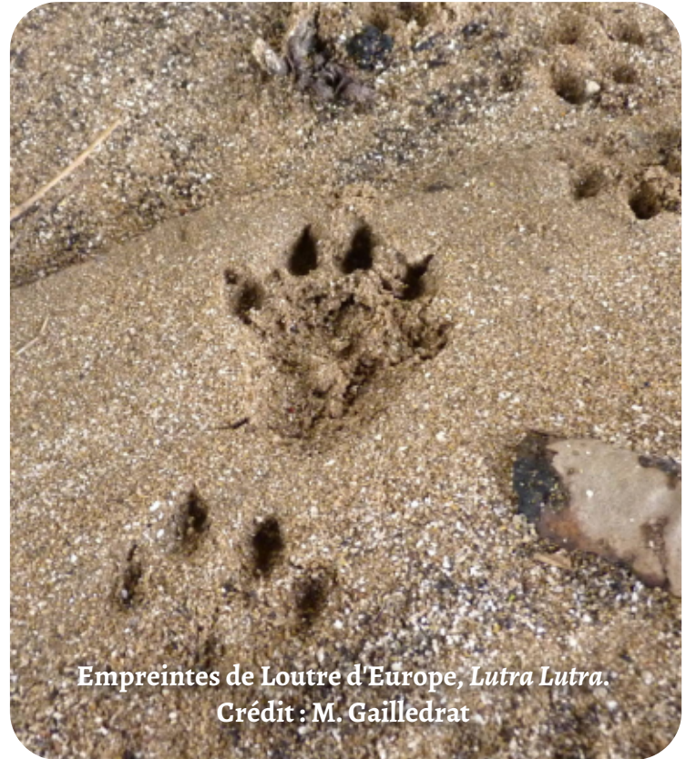
Empreintes de Loutre d'Europe, Lutra Lutra . Crédit : M. Gailledrat