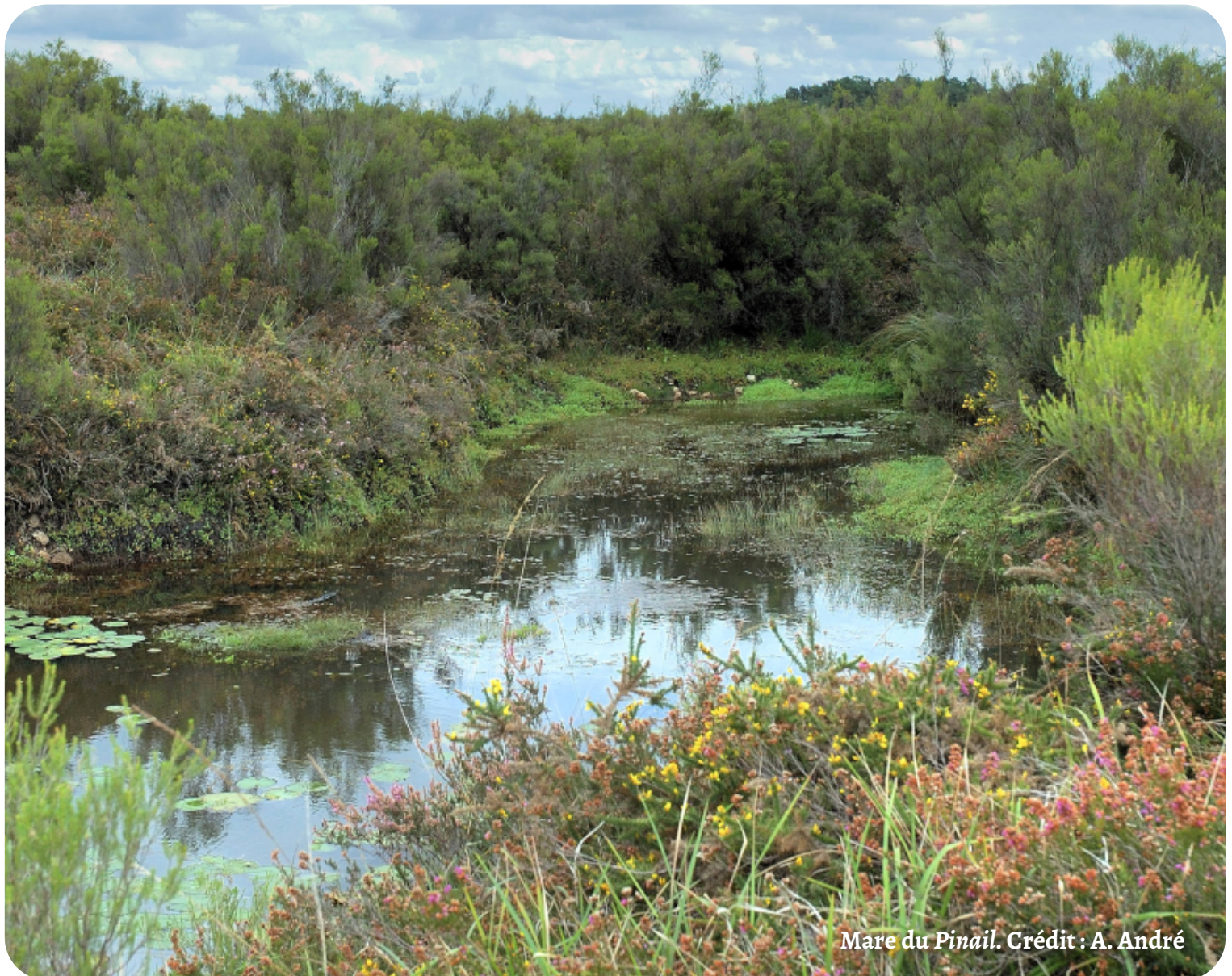
Mare du Pinail.