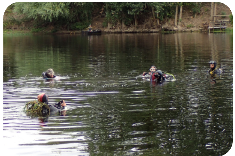
Prospection avec les plongeurs du Subaqua Club de Poitiers et du Club MANTAS .