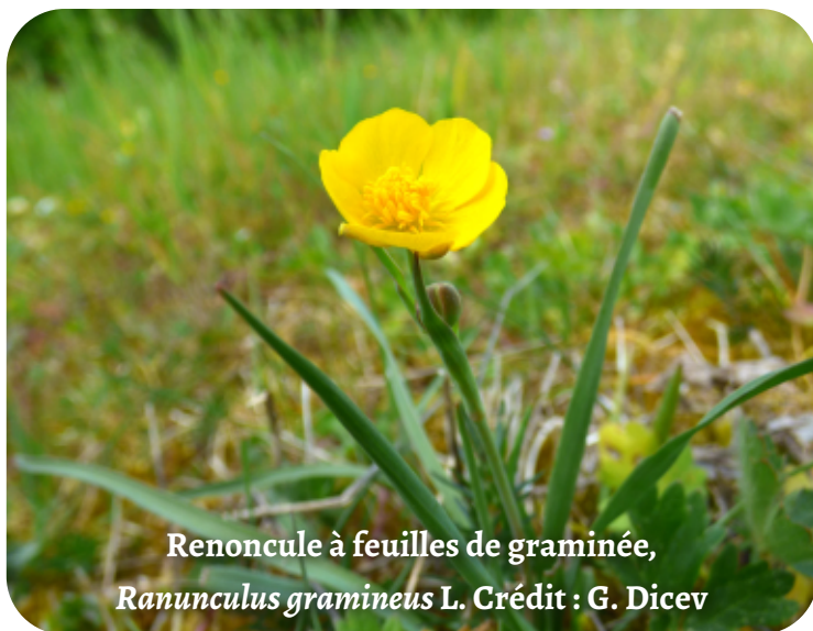
Renoncule à feuilles de graminée, Ranunculus gramineus L.