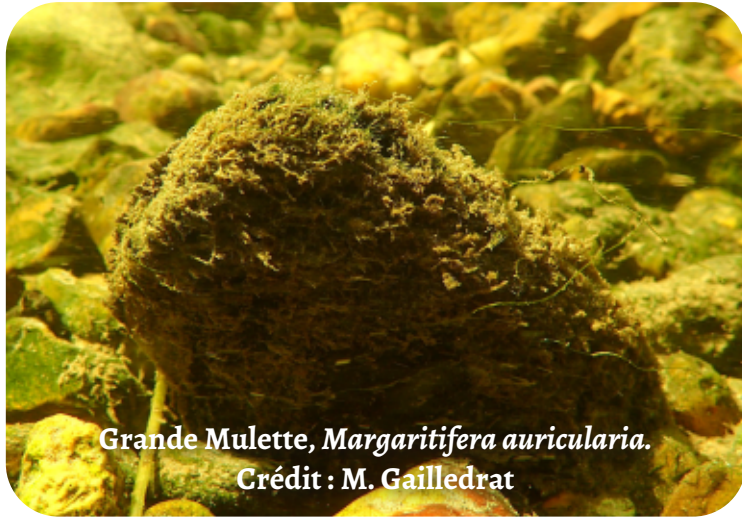
Grande Mulette, Margaritifera auricularia . Crédit : M. Gailledrat