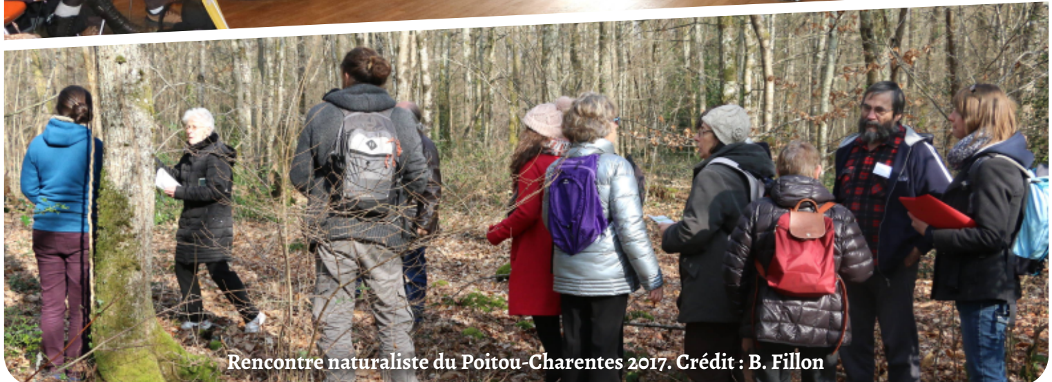
Rencontre naturaliste du Poitou-Charentes 2017.