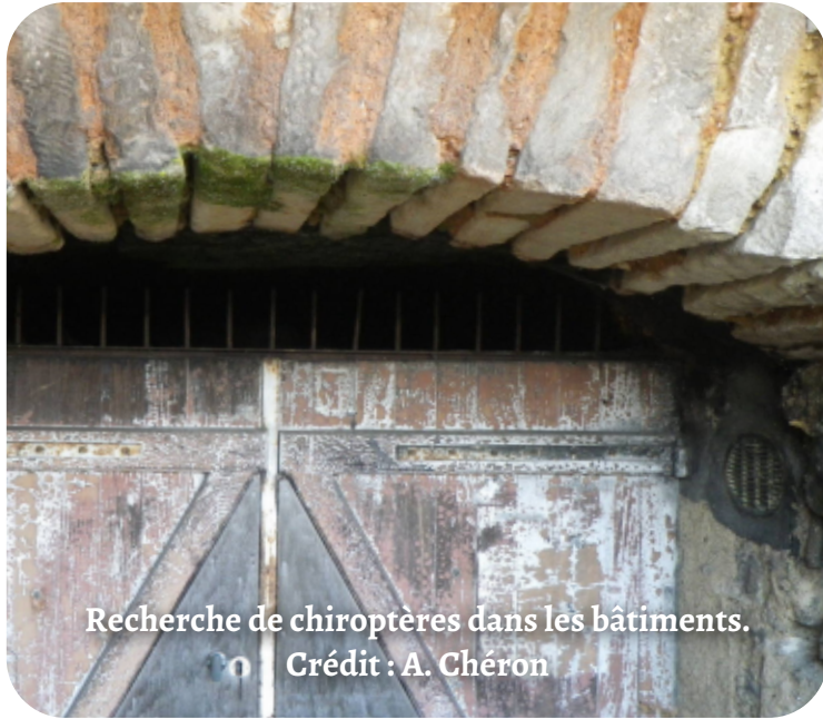
Recherche de chiroptères dans les bâtiments.