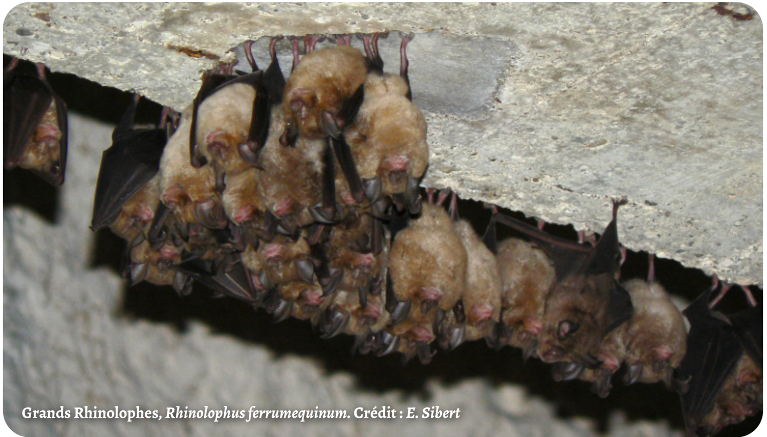
Grands Rhinolophes, Rhinolophus ferrumequinum . Crédit : E. Sibert