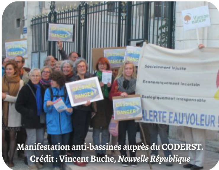
Manifestation anti-bassines auprès du CODERST.