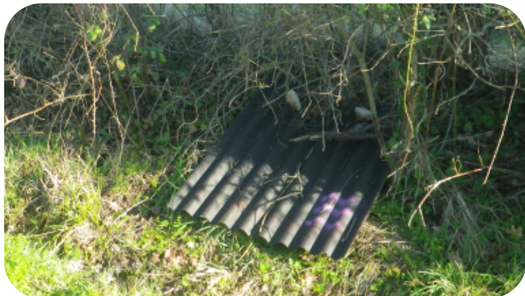
Plaque à reptiles au pied d'une haie.