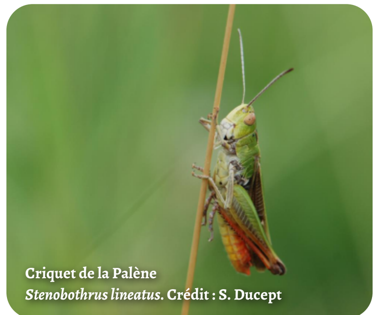
Criquet de la Palène Stenobothrus lineatus . Crédit : S. Ducept