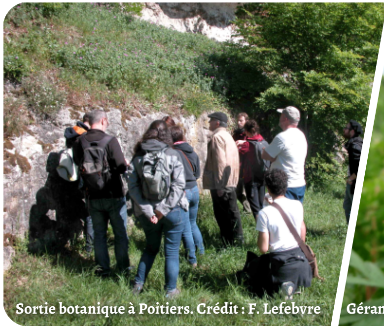
Sortie botanique à Poitiers.