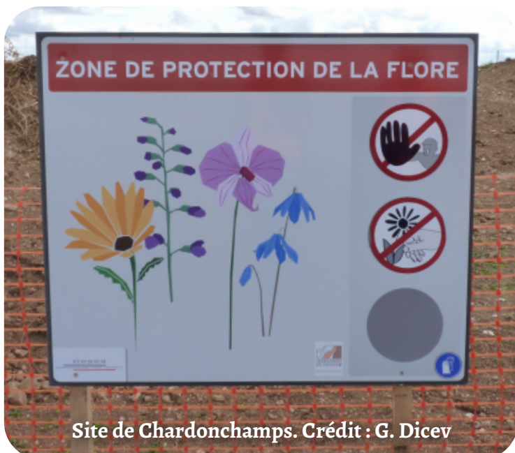
Site de Chardonchamps.