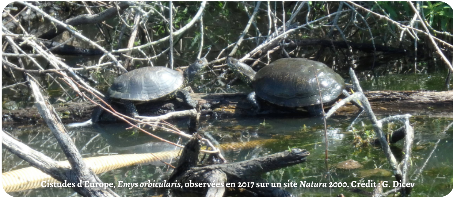
Cistudes d'Europe, Emys orbicularis , observées en 2017 sur un site Natura 2000.