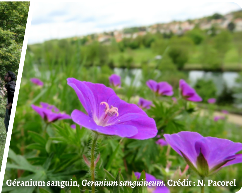
Géranium sanguin, Geranium sanguineum .