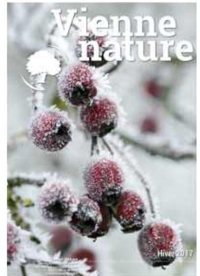
Bulletins de Vienne Nature parus en 2017.