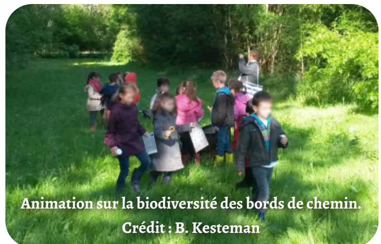
Animation sur la biodiversité des bords de chemin.