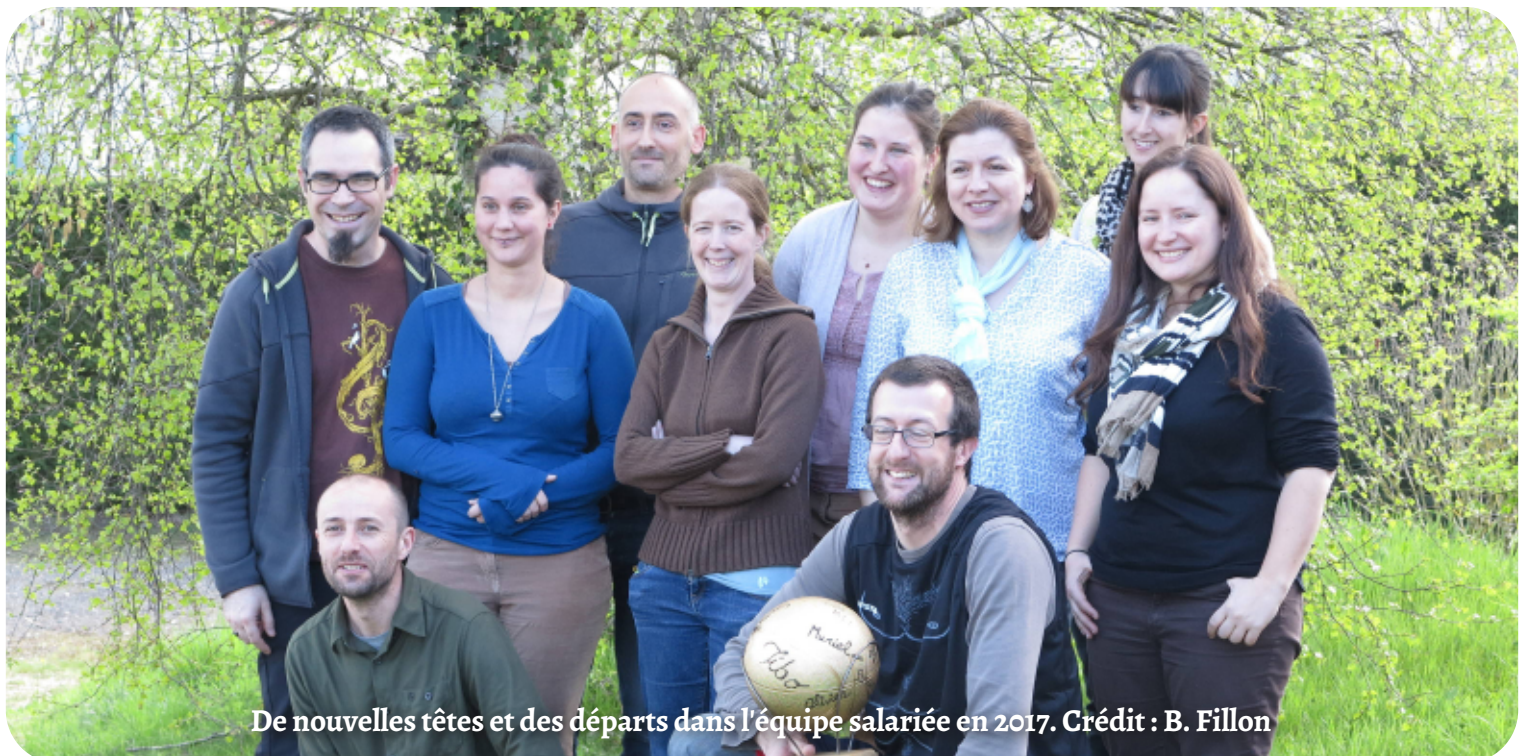
De nouvelles têtes et des départs dans l'équipe salariée en 2017.