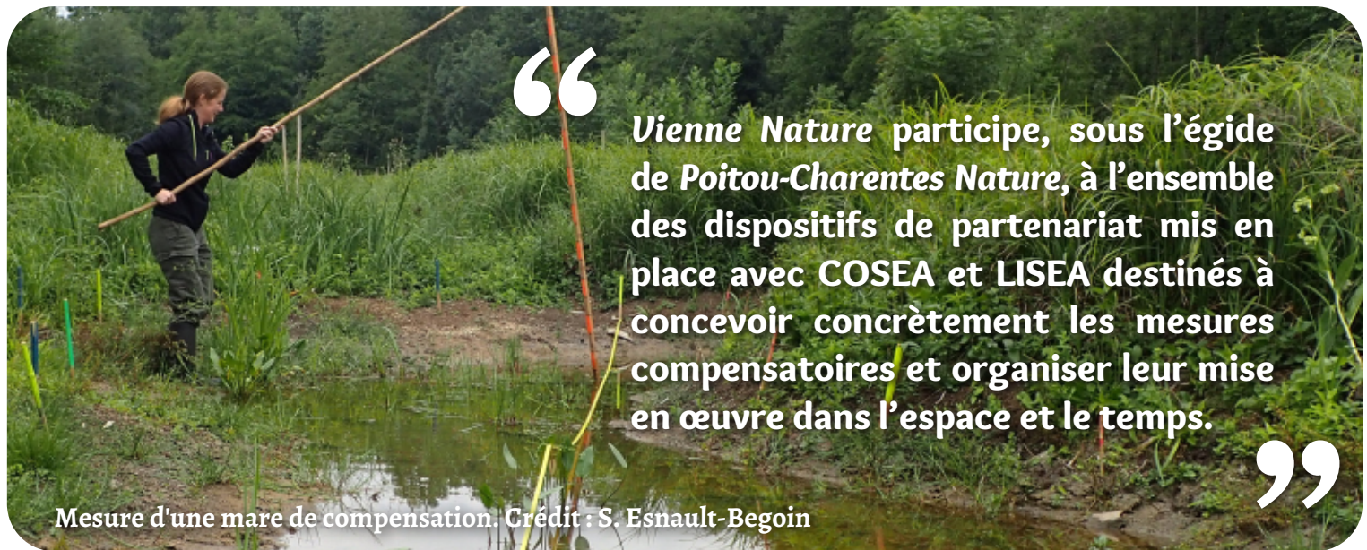
Mesure d'une mare de compensation.