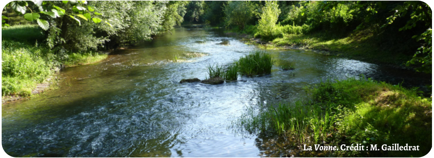
La Vonne.

Lors de la CLE de janvier 2017, nous nous sommes opposés, sans succès, à donner un semblant de cadre légal au Contrat Territorial de Gestion Quantitative (CTGQ). Cette décision tardive et précipitée aurait permis de baptiser « projet de territoire » une addition des contrats existants, contrats territoriaux milieux aquatiques, contrats Re-Ressources et stratégie du SAGE Clain non encore validée.