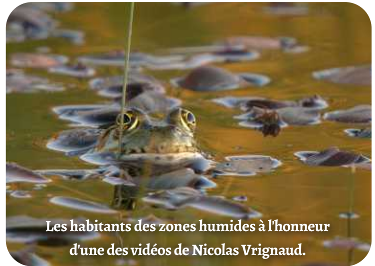
Les habitants des zones humides à l'honneur d'une des vidéos de Nicolas Vrignaud.

Près de cinquante participants de tous horizons ont assisté au colloque et ont interagi avec les intervenants au cours des différents échanges.