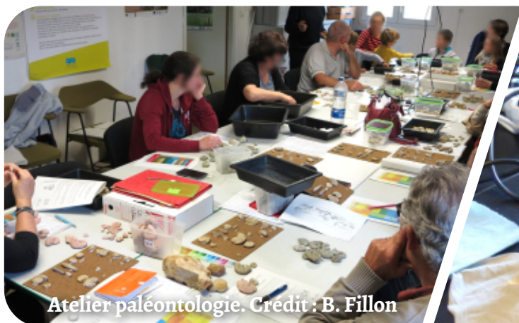
Atelier paléontologie.