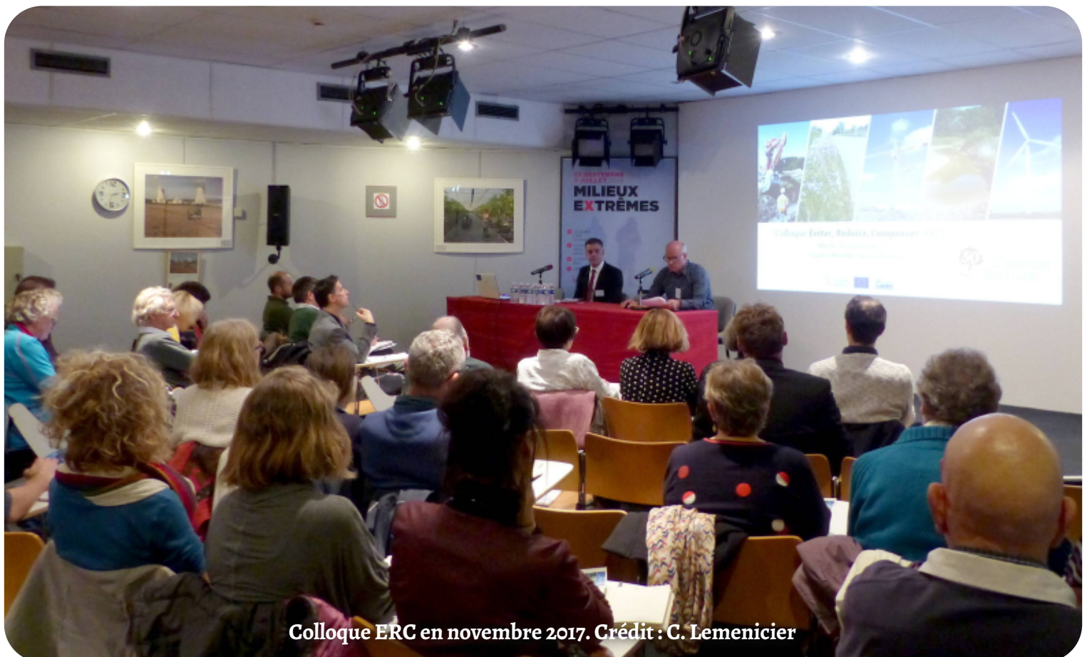
Colloque ERC en novembre 2017.