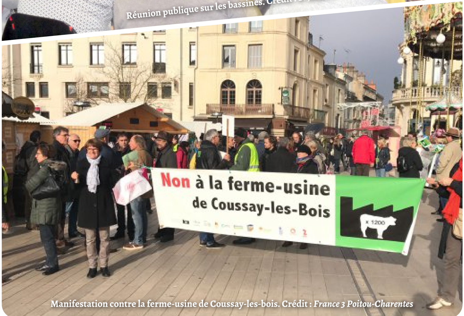
Manifestation contre la ferme-usine de Coussay-les-bois.