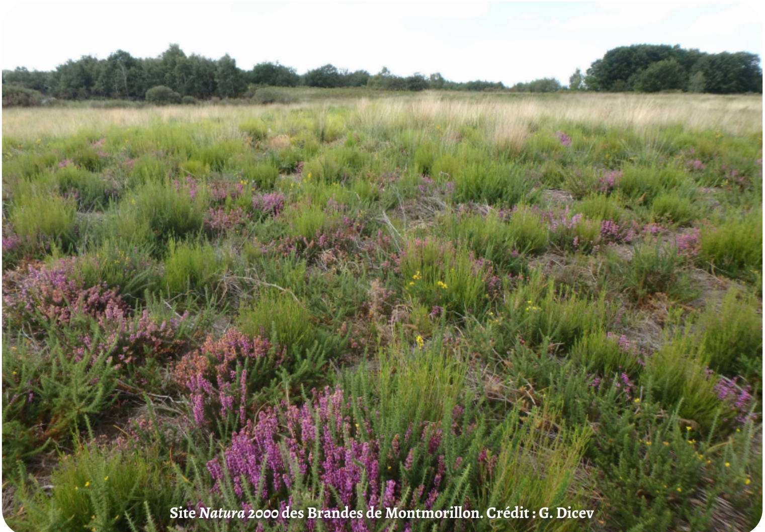
Site Natura 2000 des Brandes de Montmorillon.