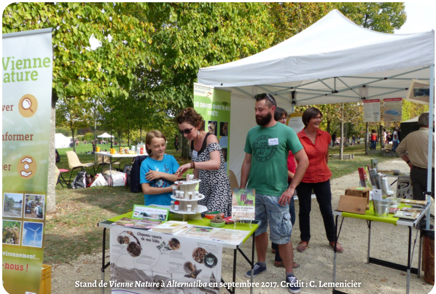
Stand de Vienne Nature à Alternatiba en septembre 2017.