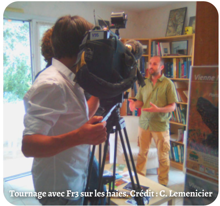
Tournage avec Fr3 sur les haies.