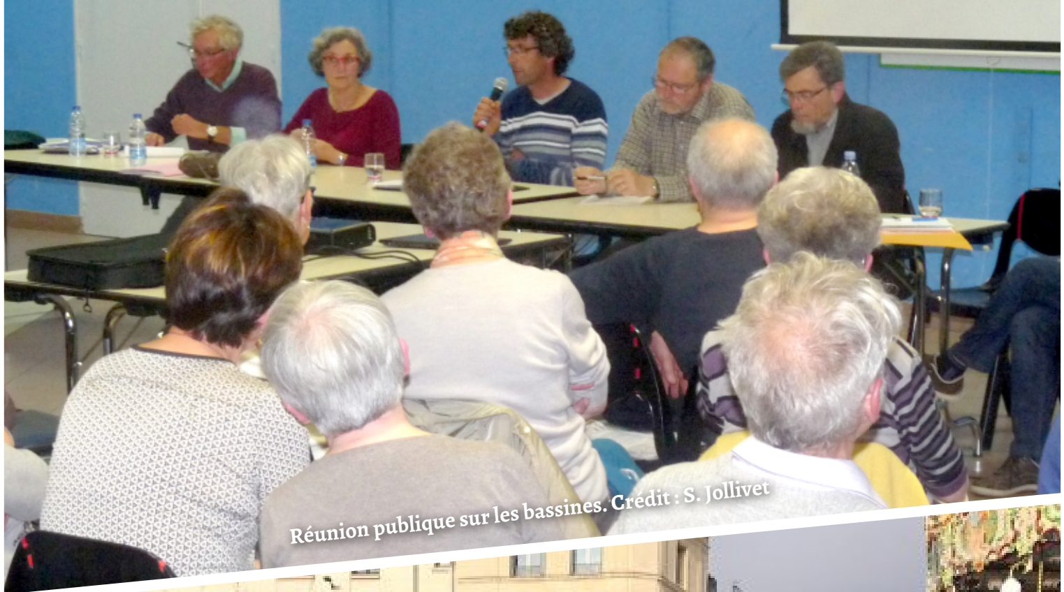
Réunion publique sur les bassines.