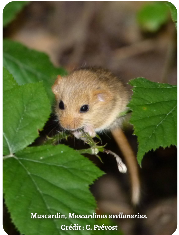
Muscardin, Muscardinus avellanarius .