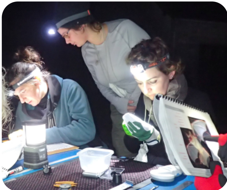
Identification biométrique de chiroptères.